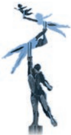
—平和都市宣言記念像— (京成千葉中央駅前)

国家の最も重要な任務だと思えます。平和の大切さを自治体の事業として行うことも大事であり、この時期に千葉市の平和事業を市民みんなで考え、参加することは極めて有意義です。平和を守ることには、そのための日々の活動が必要と思えます。人の命を大事にすること、国際の協力や友好に努めること、軍事ではなく福祉国家をめざすこと、これは武器を持たないで「人の心による闘い」だと思っています。私は、その思いを強くして取り組んでまいります。