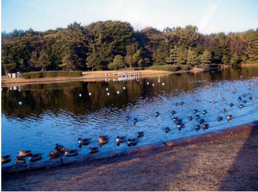
— 稲毛海浜公園内の池で遊ぶ水鳥 —

福祉を守る！そして目指す！ 「こども」「高齢者」「障がい者」を 大切にする市政へ